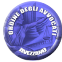
Ordine Avvocati Avezzano