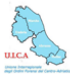
Unione Interregionale degli Ordini Forensi del Centro-Adriatico